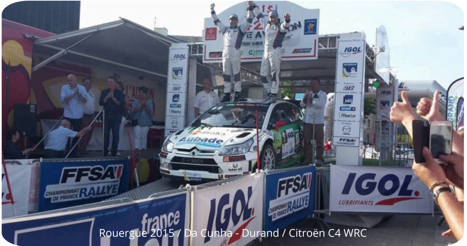
Rouergue 2015 / Da Cunha - Durand / Citroën C4 WRC