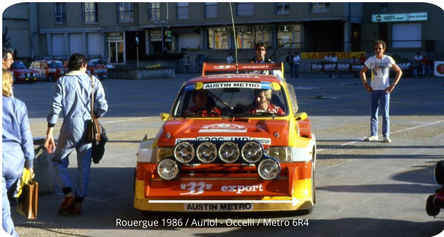
Rouergue 1986 / Auriol - Occelli / Metro 6R4