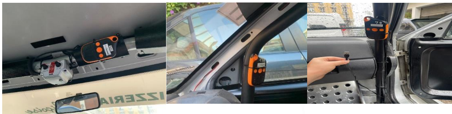
Câble Alimentation fourni par VDS 80 cm

ATTENTION prévoir suffisamment de longueur de câble pour avoir accès aux 2 emplacements obligatoires du boîtier ou utiliser une rallonge USB