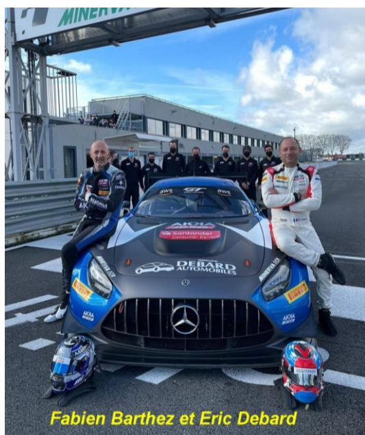
Fabien Barthez et Eric Debard