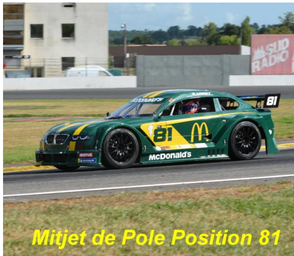
Mitjet de Pole Position 81